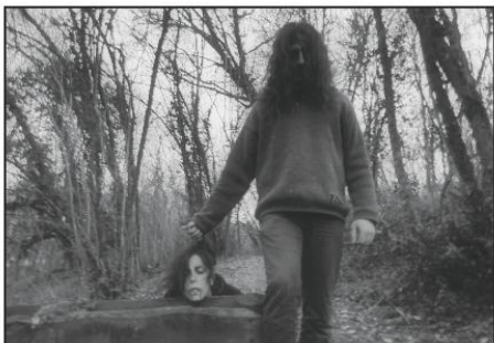
Extrait du teaser

► Le partenariat avec Wilfried, l'expérience des 3 fêlées saintaises et les 6 mois d'organisation feront la réussite de ce nouveau projet de Crazy Fit Event. Sans oublier les 60 bénévoles ! Tous déguisés et maquillés par une Professionnelle, ils seront présents sur le parcours pour surprendre et effrayer les coureurs. Avec des départs échelonnés toutes les 3 minutes, ils passeront près de 3h en forêt.